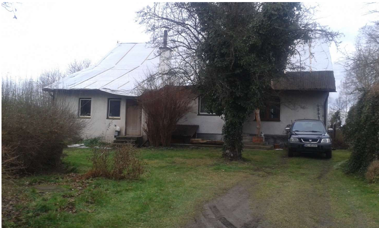
WIDOK OD STRONY POŁUDNIOWEJ