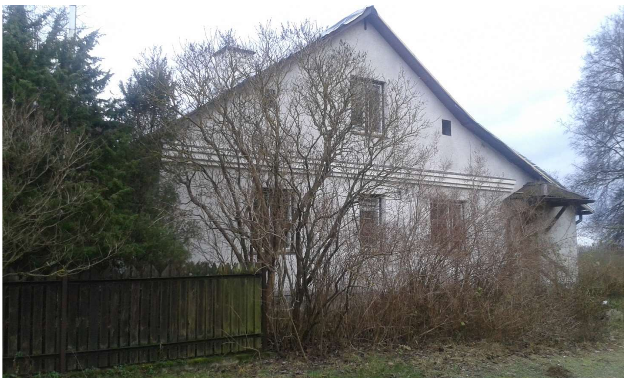
WIDOK OD STRONY ZACHODNIEJ