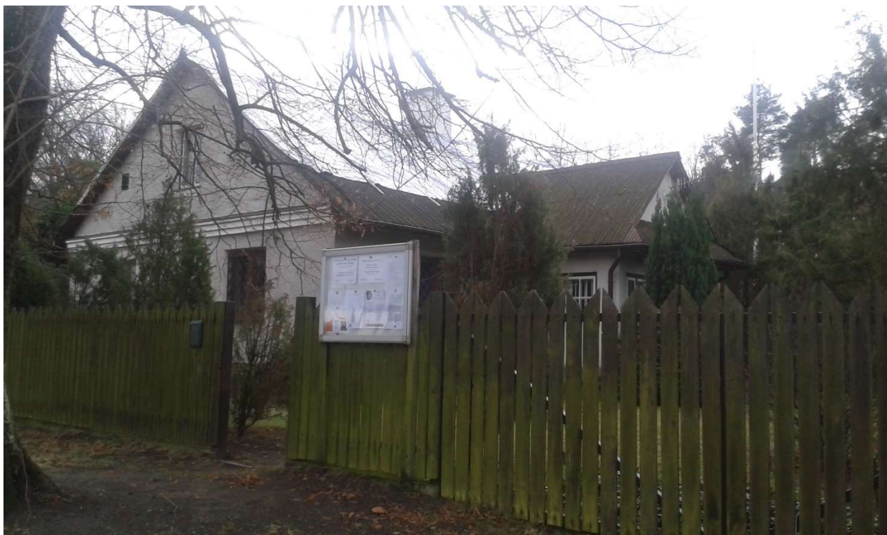
WIDOK OD STRONY PÓŁNOCNEJ