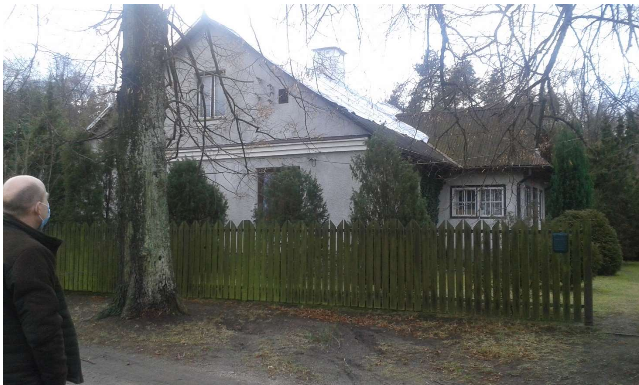
WIDOK OD STRONY WSCHODNIEJ